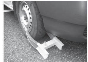
◀自動車差押の様子