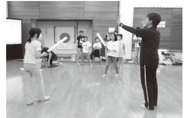
▲スポーツチャンバラ