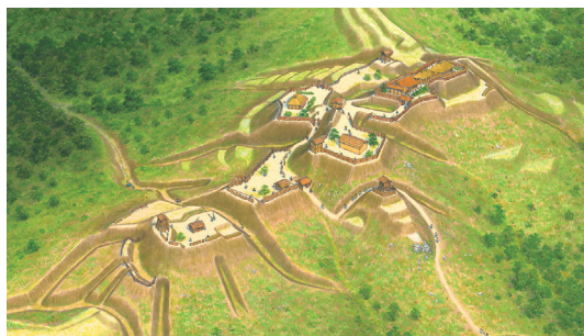
▲菩提山城復元イラスト：香川元太郎