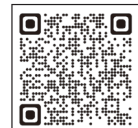
▲自衛隊岐阜地方協力本部ホームページ