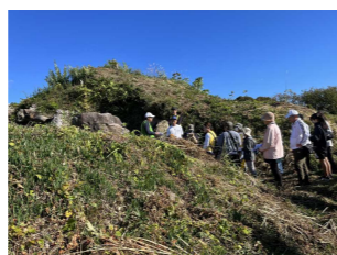
けんこうウォーク in 府中