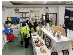
第71回府中地区特別文化祭