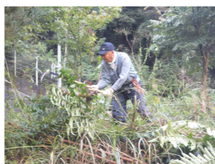
ビオトープづくり 2023