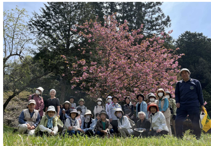
↑観音寺境内の八重桜をバックにパチリ♡

→Cafe・木工房結のシフォンケーキと飲み物で疲れが癒やされ、爽やかな風を感じられるウォークでした。