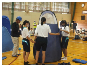
指定避難所運営訓練