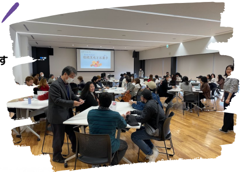
きょうしつのような 教室の様子

しゅさい：たるいちよう うんえい：たるいちく きょうぎかい ・主催：垂井町 ・運営：垂井地区まちづくり協議会