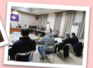
2月25日防災交流会開催しました