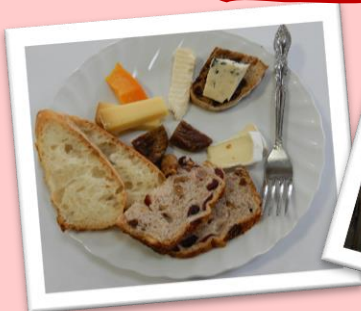
2月23日チーズ・ワイン教室開催しました