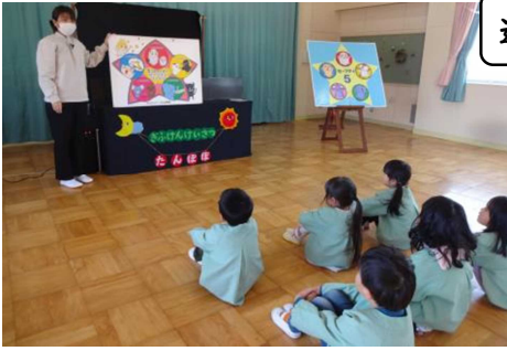
連れ去り防止教室（４・５歳児）