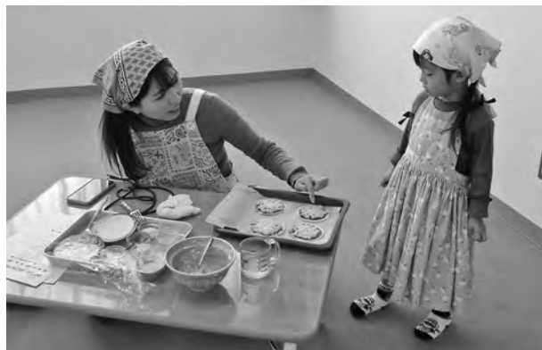
◀にこにこキッチンの様子