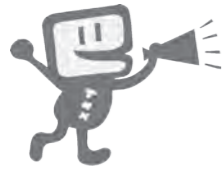
国税庁e-Taxキャラクター イータ君