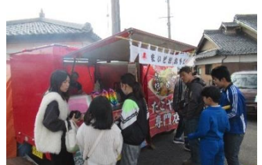
キッチンカーも登場