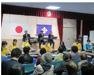
琴クラブ・千壽会(琴)