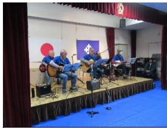
フォークカナデーテ(フォークソング)