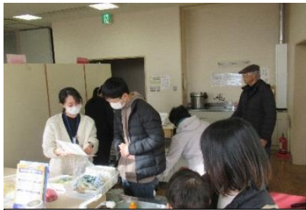
保健センター・健康チェック