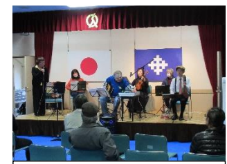
フラワースtringス(ウクレレ)