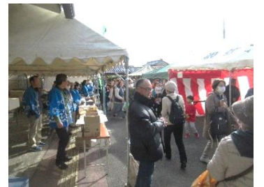
賑わう屋外テント