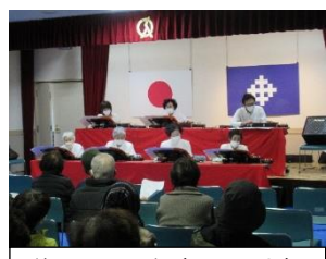
第一千里会(大正琴)