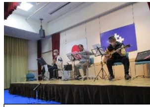
あいの風(ギターとハーモニカ)