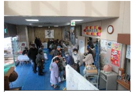
賑わいを見せるロビー

11月26日(日)、表佐地区文化祭が、表佐地区まちづくりセンターを会場に開催され、約900人の皆さんが、楽しいひとときを過ごしました。