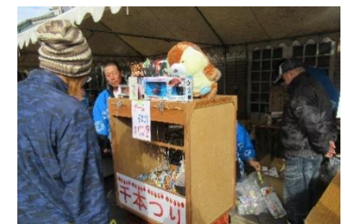
商工会千本つりコーナー