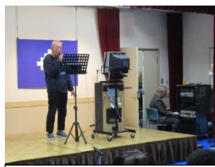
演歌こいこい(カラオケ)