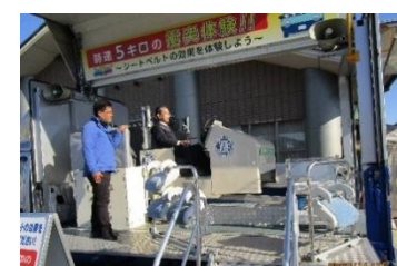
JAFシートベルト体験車