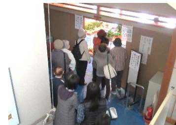
農産物展の開催を待つ人たち