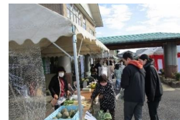
地元農家の即売コーナー