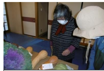
じっと品定め? 農産物展