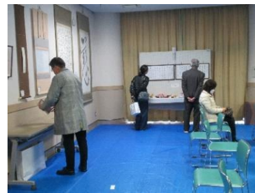
こども園作品展示