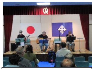
60G&H(ギターとハーモニカ)