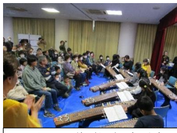
子どもお箏教室(琴)