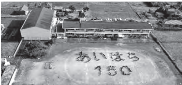
▲地区のみなさんによる人文字写真

11月12日(日)に、合原小学校創立150周年を祝う記念式典が開かれ、式典では記念品の贈呈や、栗原地区の地図をペットボトルの蓋を用いて表現したキャプアートが披露され、150周年を祝うことができました。当協議会は、合原小が200周年・250周年を迎えることができるよう、今後も地区の発展や子どもの健全育成などに努めていきます。