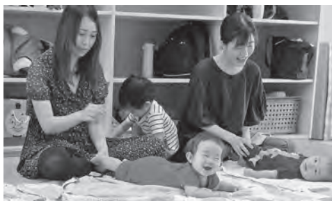
◀ベビーマッサージの様子