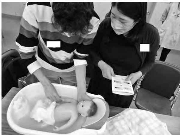
▲ペアクラスの様子