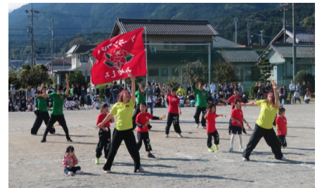
長寿会・1年生合同玉入れ