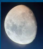
月明かりがまぶしい、その月の望遠鏡写真

昨年も参加された方から、今年は見られてよかったとお声がありました。 星空案内人のお話が楽しかった、望遠鏡から星を見て、わあーすごーいと歓声をあげちゃった、日常と離れてリラックスできたなど、たくさんのうれしい感想をいただきました。