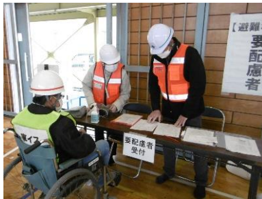
昨年12月の地区防災訓練の様子(車いす利用者の受付)

また、日頃から表佐地区の防災・減災活動をしている「防災ネットワークOSA」としても、この防災訓練に参加します。避難所の開設は町が行うのが原則ですが、大規模災害発生時には町職員の派遣が困難な状況も想定されます。その場合、表佐地区民が積極的に避難所開設に関わる必要があります。