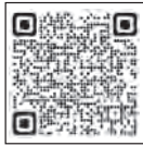
▲決済サービス 毎の申込期限

申込期限が近づくと窓口が混み合うことが予想されますので早めのポイント申込をお願いします。決済サービスによっては、申込期限より前に終了するものがあります。詳細はQRコードからご確認ください。