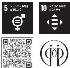
▲垂井町第3次男女共同参画プラン