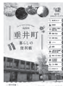
▲暮らしの便利帳のイメージ