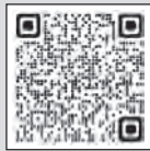
▲マイナポイントの詳細

問 マイナンバー総合フリーダイヤル ☎0120-95-0178 企画調整課 行政改革・デジタル推進室 ☎22-1152