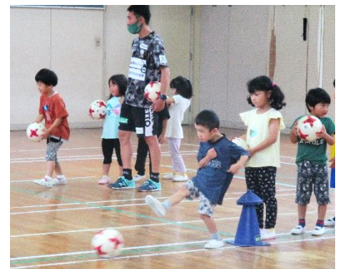
FC 岐阜サッカー教室