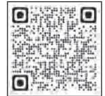
▲垂井町第3次男女共同参画プラン

このような課題に対応するため、防災政策の方針を決定する場や災害時などに、女性の意見が取り入れられる体制を整備し、男女ともにリーダーシップを発揮できる環境づくりをしていきましょう。