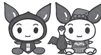
岐阜県のご当地けんけつちゃん