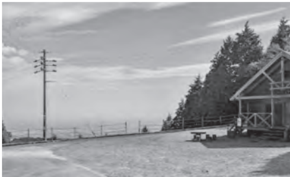
▲明神の森：関ヶ原方面を一望できます