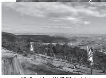
▲智将 竹中半兵衛の山城： 菩提山城跡