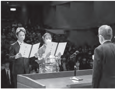
▲「二十歳を祝う会」の様子