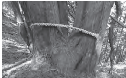
▲逆さ杉：ヤマトタケルの伊吹山 荒神退治にまつわる伝説の杉