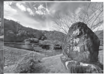
▲明神湖：洪水調節ダム