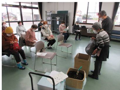
↑昨年度開催した段ボールコンポスト講習会の様子

昨年度、段ボールコンポスト講習会を4回開催。約70名の住民が参加し、段ボールコンポストにチャレンジしました。参加者を対象にアンケートを行ったところ、段ボールコンポストの扱いについて、簡単と回答したのは59%、18%は難しく感じたようです。また、 87%の方がごみ減量の成果を実感 しており「今後も段ボールコンポストを継続されますか」という問いに、全員が「はい」と回答してくれました！