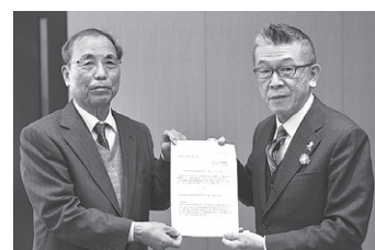
▲答申書を手渡す行政改革審議会中谷会長(左)