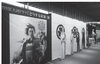
NHK大河ドラマ「どうする家康」展・ぎふ 関ヶ原 主催：(一財) NHKサービスセンター