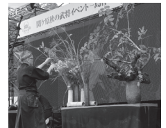
花いけバトル(令和元年)

令和5年観光シーズンの幕開けとして、関ヶ原で春開きイベントを開催します。春を感じる「花いけバトル」や花飾り体験の他、武将隊による演武合戦、地元飲食店によるグルメ出店など様々な催しを行います。