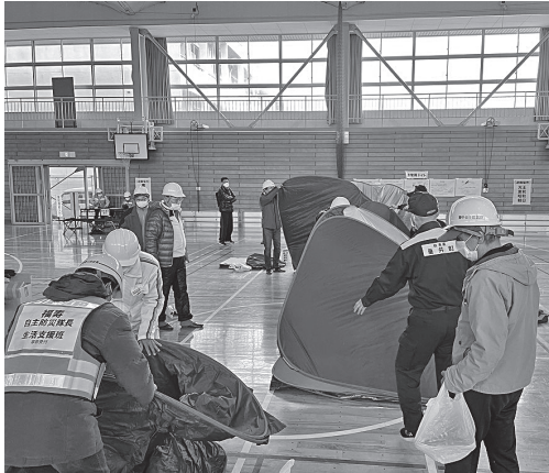
▲パーティション設営の様子(表佐地区)

住民主体の実践的な防災訓練が表佐地区と府中地区で実施されました。自然災害が発生したことを想定し、避難者の受付、パーティション、ベッドを設置するなど感染症対策に配慮した避難所運営を実践しました。町は、継続して防災資機材の備蓄や避難所機能の充実など「公助」の役割を図っていきますが、何より一人ひとりが自ら取り組む「自助」、地域や身近にいる人同士が助け合って取り組む「共助」の力が重要です。災害がいつ発生しても対応できるよう日頃からの準備を大切にしましょう。