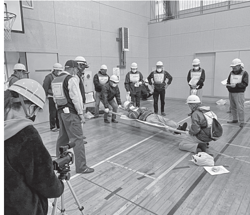
▲負傷者を担架で運ぶ様子(府中地区)