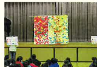
あいさつもみじ・さんづけいちょうの木

さらに、今年度は、児童会中心に「東小みんなのちかひ」が制定されました。あいさつの声が飛び交い、誰とでもなかよく、心と体を大切にしたい、思いやりのある言葉で話す「光の子」に向かって取り組んでいる東小です。