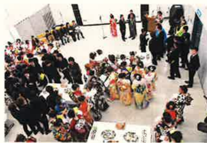
不破中メモリアルパーティー