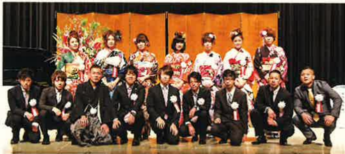
成人式実行委員のみなさん