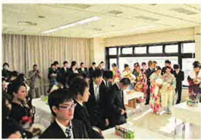
北中メモリアルパーティー