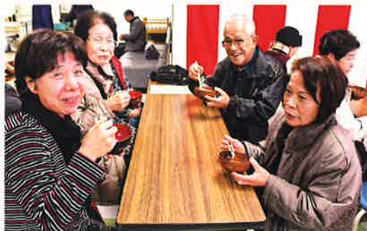
保健センターで七草がゆの振る舞いがありました。七草のほか、焼き餅と梅干しが入った豪華なお粥に訪れた大勢の方々には舌鼓を打ち、用意された800食はすべてなくなりました。