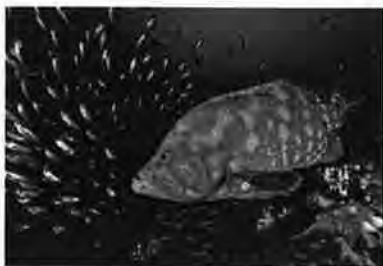
「アザハタ」(中村武弘)

日本自然科学写真協会は、自然科学写真に携わるプロ、アマチュア写真家、専門家の集まりです。動植物、水中、天体、地形、風景、顕微鏡など多彩な自然科学写真を通して、科学の眼で自然と向き合う楽しさを感じてください。