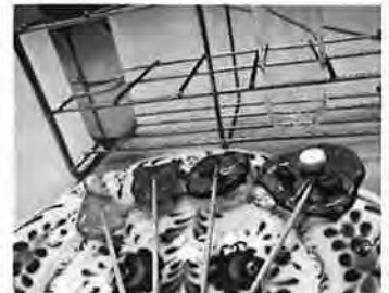
お砂糖で理科実験

なめると甘~い砂糖。その砂糖を使った理科実験に挑戦します。砂糖に潜む科学の秘密を実験から探ってみよう。