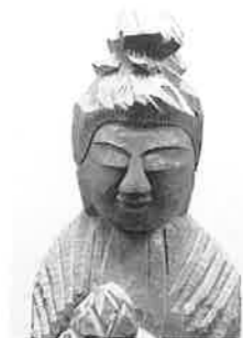
観音菩薩立像(聖観音) (生御自治会蔵)

江戸時代の僧侶、円空は、美濃国に生まれ、日本各地で現存数5000体を超える仏像を造りました。この特別展は円空仏が集中して現存する東海地方に焦点を当て、貴重な円空仏や円空が描いた希少な絵画合わせて約80点の見応えのある展示となります。展示を通して、それぞれの地域で円空がどのような足跡をのこしていったのかを探ります。東海3県の円空仏が一堂に会するまたとない機会です。