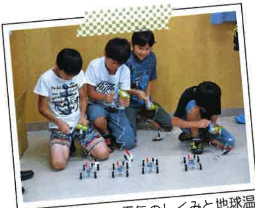
7/22 実験で知る電気のしくみと地球温暖化