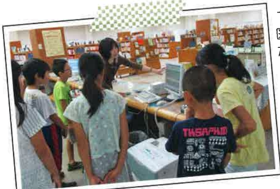
7/28 図書館 たんけん