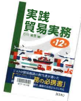
実践貿易実務 (石川雅啓、JETRO)

顔を出さず、ウェブやネット上でのみ活動する謎の12人ユニット、さよポ二初の作品集。