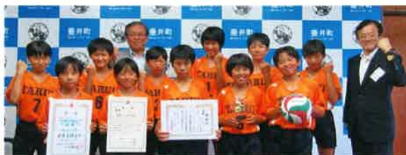
▲垂井バレーボールスポーツ少年団

選手らは「笑顔でプレーしたい。」「優勝を目指す。」など、大会での抱負を話すと、町長は、「感謝の気持ちを忘れず、応援してくれるみなさんの力をもらい、全力でプレーをしてください」と激励しました。