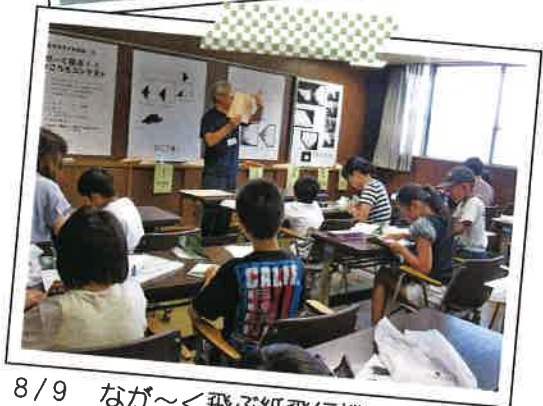
8/9 なか～く飛ぶ紙飛行機コンテスト