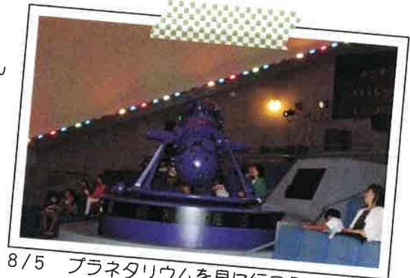
8/5 プラネタリウムを見に行こう