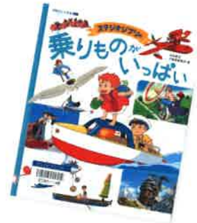
スタジオジブリの乗りものがいっぱい (徳間書店)

貿易実務の必携書最新版。流れと基礎知識からトラブル解決までを提供。著者は垂井町出身。