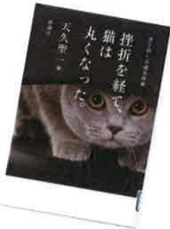
挫折を経て、猫は丸くなった。 (天久聖一、新潮社)

ここにあるのは416の小説の書き出しだけ。あとは読み手がストーリーを想像する自由な文学。