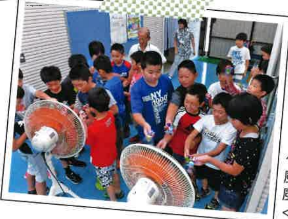
7/26 ペットボトル 風車を作って 風力発電のしくみを学ぼう