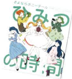
ひみつの時間 (さよならポニーテール、ポプラ社)

ここにあるのは416の小説の書き出しだけ。あとは読み手がストーリーを想像する自由な文学。