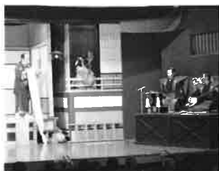
鳳凰座歌舞伎公演「一茶屋」

開館1周年を記念し、県が誇る「地歌舞伎」の特別公演を開催します。当日は、鳳凰座歌舞伎保存会（下呂市）による公演の他、地元下呂市の特産品の販売も行います。また、公演終了後、ぎふ清流文化プラザの新モニュメントを披露します。