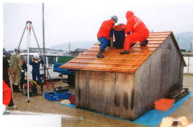
平成27年度 町防災訓練(栗原地区)

町では、ジャッキやバル、のこぎりなど、救出・救助用の資機材を各地区1ヶ所、計7ヶ所の防災倉庫で備蓄しています。各自治会単位などでの防災資機材の整備については、補助金を交付し、活動を支援しています。また、災害時に物資の提供などをさせていただく災害時の応援協定を企業などと締結しています。その他、災害時の情報伝達については防災行政無線・登録制のメール・電話応答のサービス・広報車など伝達手段を確保し、災害に強いまちづくりを進めています。