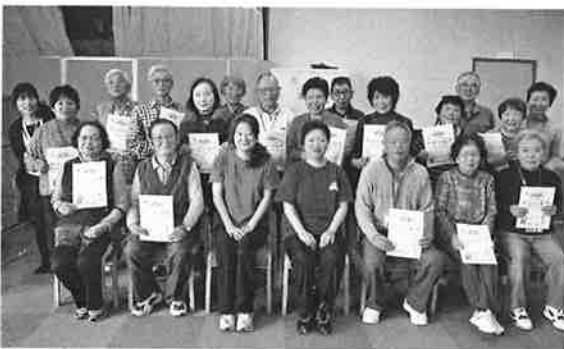
▲修了証書を受け取られた受講者のみなさん

半年以上、ともに過ごした受講者のみなさんの間には、強い絆が生まれ全員で笑顔の卒業となりました。