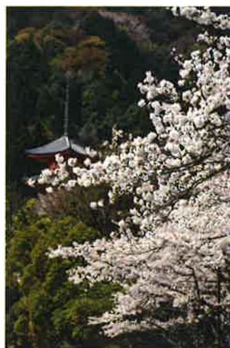
4月、桜の季節となりました。町内では相川の桜を見に行かれる方が多いかもしれません。写真は昨年満開になったときに撮影したものです。