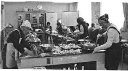
▲開校式の後行われた成果発表(家庭料理の試食)の様子