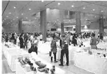
イメージ(昨年の展示会の様子)

人間国宝である鈴木藏氏、加藤孝造氏をはじめ、新進気鋭の若手作家に至るまで、美濃を拠点に活動する陶芸作家約130人の作品が集結する一大展示販売会です。出品作家による「実演ステージ」や、「ぐい呑み展」等の企画展も同時開催します。これだけの作家が一堂に会し、見て触れて購入できる展示会は「陶芸作家展」だけです。ぜひお越しください。