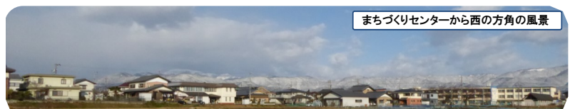
まちづくりセンターから西の方角の風景