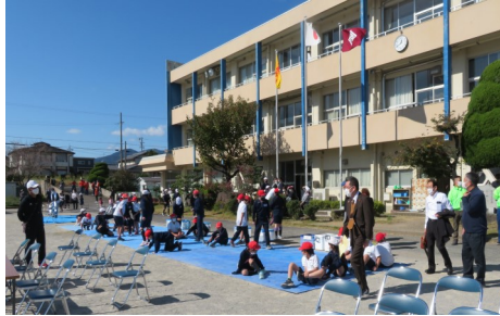
ソーラン踊り(ソーランつばき)