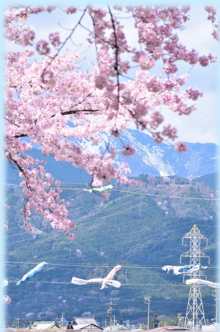
相川水辺公園から望む