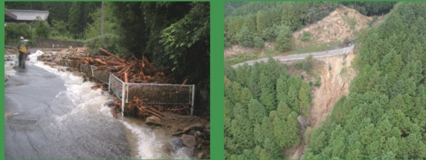
垂井町梅谷地内 平成20年 (台風被害)