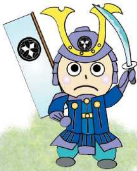
中学生ワークショップで提案されたイメージキャラクター 「半兵衛クン」