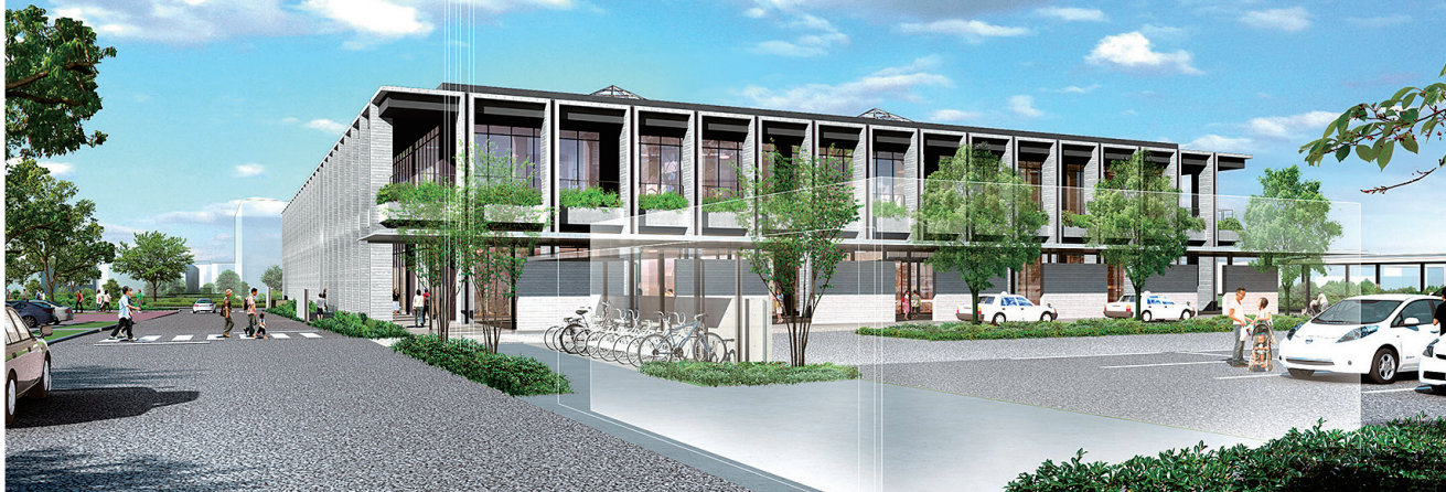
▲北西から見た新庁舎完成図 ※現時点でのイメージであり、今後変更となる可能性があります。