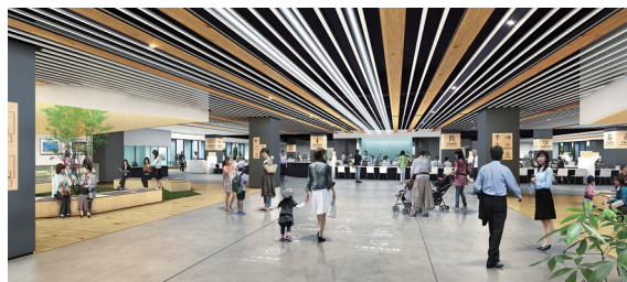
▲庁舎棟エントランスイメージ