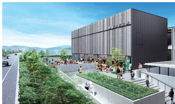
▲(仮称)垂井ホール外観イメージ