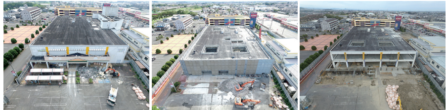
西側上空から見た活用する既存建物のようす (撮影日 左:6月26日 中央:9月12日 右:11月6日)