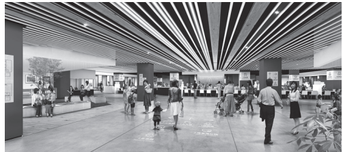
内装完成イメージ

外部サッシ(窓ガラス)を施工し、外部と内部が分離しました。今後、さらに内装工事を進めていきます。エレベーターなど設備の設置も着々と進み、ホール棟では1階の天井が完成しました。