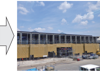
現在(令和元年5月時点)