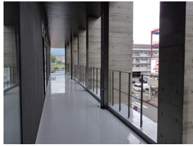
東面(アウトフレーム部)

外付けフレームの施工が終わり、外部の足場が外れました。外観がよく見えるようになりました。シックなデザインで落ち着いた雰囲気が特徴です。