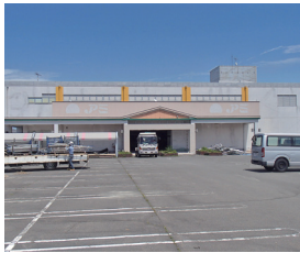
着工時(平成30年6月時点)