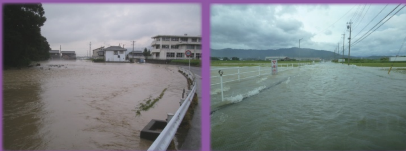
垂井町町中地内 平成 20年 9月 2日 (ゲリラ豪雨による梅谷川氾濫) 垂井町栗原地内 平成 25年 9月 15日 (台風 18号)

このマップは、垂井町内を流れる主要河川、および牧田川が大雨によって増水し、堤防が決壊した場合の浸水予想結果に基づいて、住民のみなさんの避難に役立つように、浸水の範囲とその深さ、ならびに避難場所などを示したものです。洪水が発生するおそれがあるときは、役場から避難情報が出されますので、このマップを持ってすみやかに避難してください。また、大雨の時は、雨の降り方や家のまわりの浸水状況に注意し、危険を感じたら早めの避難を心がけましょう。