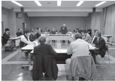
▶活発に審議をする委員たち

そのほか、人口減少対策、子育て、学校教育について提案をいただき、最後に答申案について協議しました。