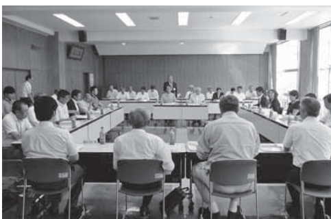
▲総合計画審議会のようす

第1回目の会議では、各種アンケート調査や住民ワークショップの結果をもとに検証した、垂井町の現状分析と課題整理の結果について報告しました。 そのときに出た課題から導き出した、テーマ別戦略のテーマや目指すまちの姿の案を提示し、計画の骨組みについて今回の会議で審議を行いました。 さらに、今後の人口減少社会を見据えて、今後起こりうる事態とその対応方法などについて、委員のみなさんから提案や意見をいただきました。