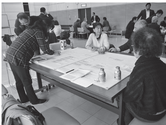
▲住民ワークショップの様子

第2回目は、第1回目で話し合った町の課題や地域の資源に基づき、目指すべき将来の姿とそれを実現するための取り組みについて意見を出し合い、グループごとに発表していただきました。