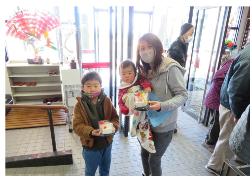
第2回 回答と景品(ケーキ) 12/20