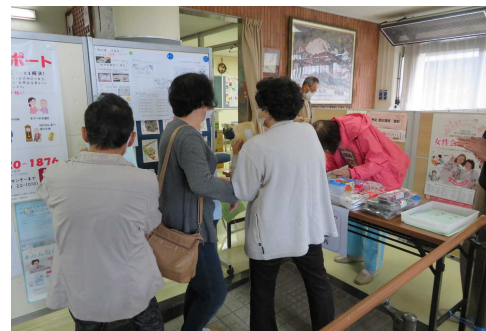
第1回 回答と景品 10/23