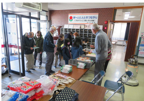
第2回 回答と景品 12/20