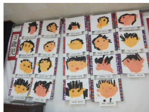
第69回 府中地区文化祭