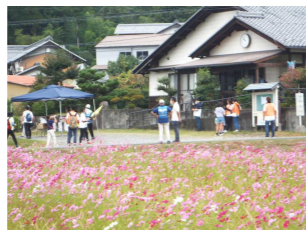
けんこうウォーク in 府中