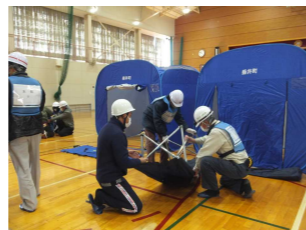
指定避難所運営訓練