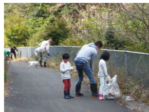
ビオトープづくり 2021