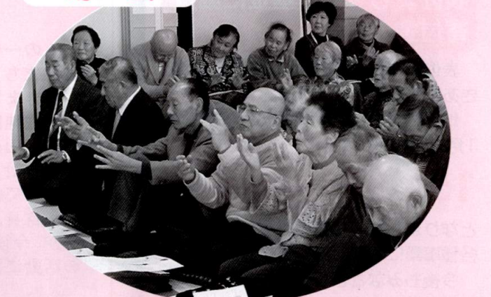
リズムに合わせて1・2・3！