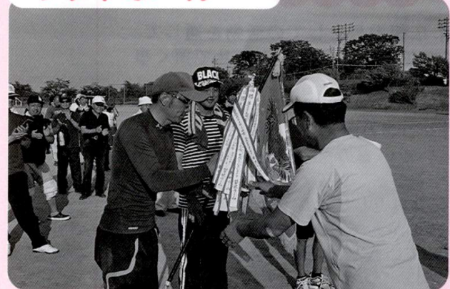
習北 優勝おめでとう！