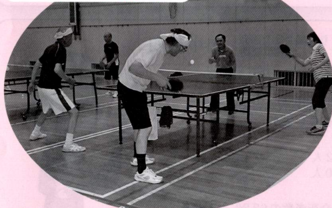
いい汗かいてます