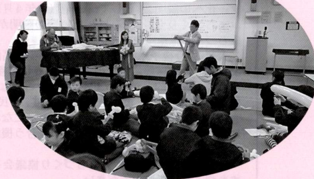
三世代 何ができるかな？