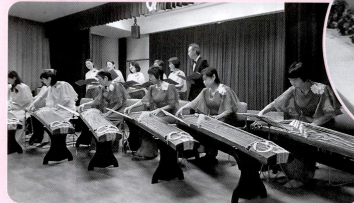
川の流れのように～♪