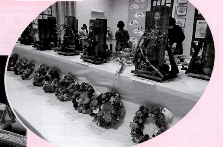
すばらしい出来栄です