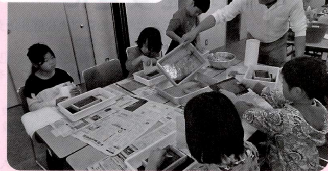
野菜で紙ができたよ！