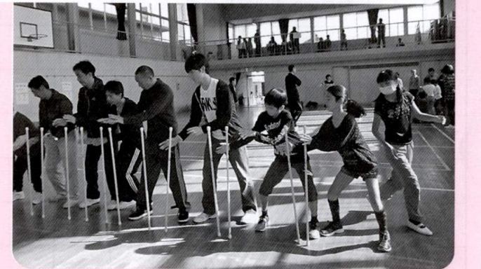
みんなで息を合わせて