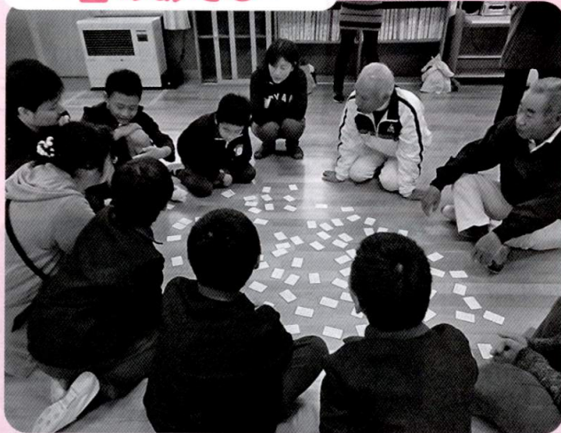
三世代 懐かしいかるた遊び