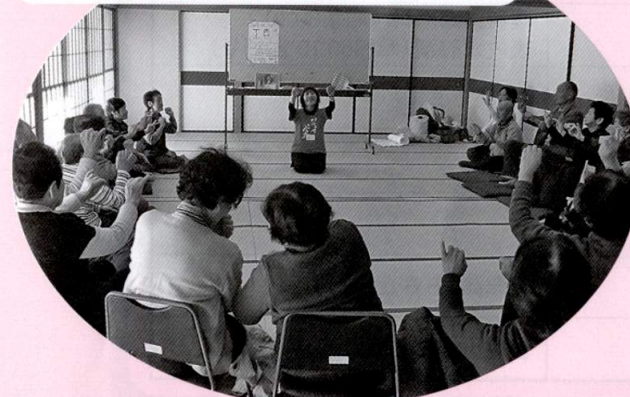
まずは、ウォーミングアップ