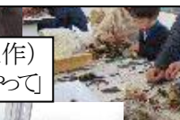
木の実のリース おばあちゃんに教えてもらって