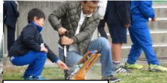
ペットボトルアート「飛べー！」