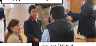
昔の遊び お父さんが夢中?