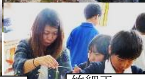
竹細工「うまくのっかって！」