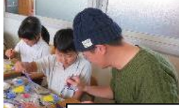
ストーンペインティング お父さんと一緒に