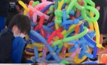
バルーンアートこれぞアート?!