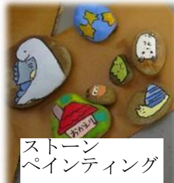
ストーンペインティング