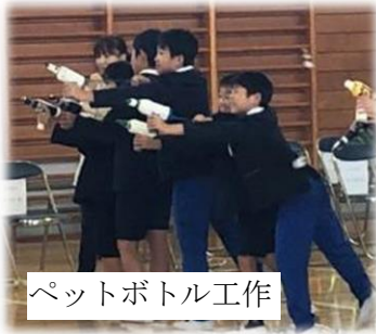
ペットボトル工作