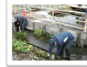
ほたるの里づくり