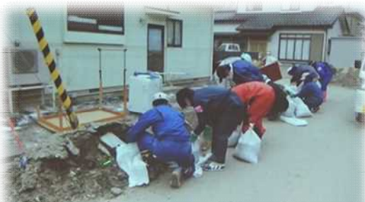
ボランティアによる清掃作業(大槌町)