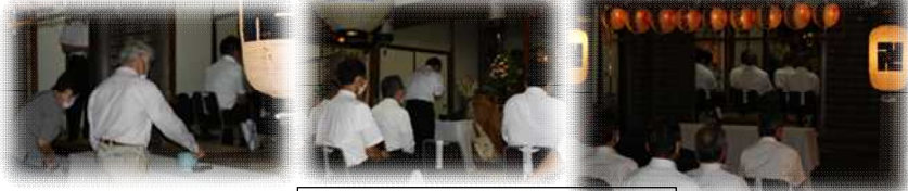
地藏院・盆供養(8月15日)

習井地藏堂は、比女神社の北にあり、表佐の西の守りとして大正8年に現在地に建てられました。中に延命地藏尊がまつられており、習井地区