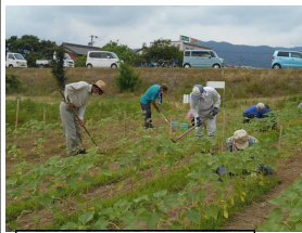
ひまわり畑の整備

今年度様々な行事が中止・延期となる中、寿会では今年も喰違(くいぢがい)地区の相川河川敷で『ひまわり』を栽培しました。一番花に水分が必要な時期に日照りに遭い、今ひとつ元気がありませんでしたが、太陽に向かって元氣よく咲くひまわりの花言葉である『愛慕』『貴方は素晴らしい』を持って地域に活力を与えられたらいいと願い、ひまわりの風景写真をまちづくりセンターやこども園に掲示しました。