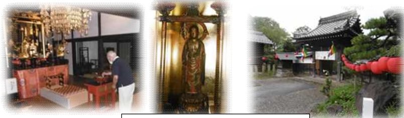
阿弥陀寺・地藏盆(8月24日)

三自治会が毎年持ち回りでお守りしています。 24日(火)には阿弥陀寺でも地藏盆の法要が執り行われ、普段本堂脇のお厨子に安置されている地藏様も、この日はご本尊前で開帳され、地域の人々が参拝に訪れていました。