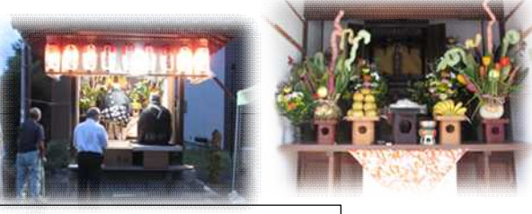
習井地藏尊・盆例祭(8月22日)