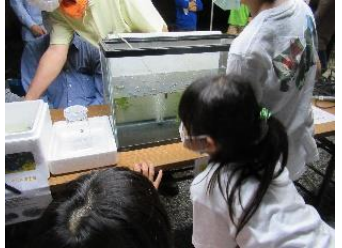
ハリヨが展示された水槽を興味深く見ている

表佐周辺に生息するほたるの種類はゲンジボタルで、成虫の体長は15mm前後、寿命は一週間ぐらいで他の種類より発光が強いのが特徴です。昼間は葉の裏で休み水滴をなめ、夜8時頃から飛び始めます。 私たちハリヨ・ほたるを育てる会は、ほたるの飼育管理を通じて、こうした自然環境を保全し後世に伝えるとともに、子供から大人までが楽しめる地域づくりの一つとして、ハリヨ・ほたる観賞会をまちづくり協議会や商工会と一緒に実施してきています。