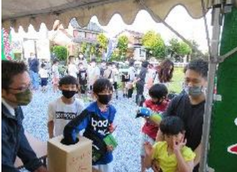
何があたるかな お楽しみくじ