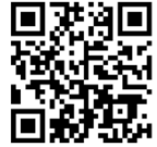
まち協ホームページQRコード