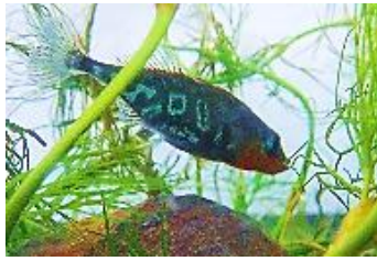
婚姻色も鮮やかなオスのハリヨ

表佐周辺に生息するほたるの種類はゲンジボタルで、成虫の体長は15mm前後、寿命は一週間ぐらいで他の種類より発光が強いのが特徴です。昼間は葉の裏で休み水滴をなめ、夜8時頃から飛び始めます。 私たちハリヨ・ほたるを育てる会は、ほたるの飼育管理を通じて、こうした自然環境を保全し後世に伝えるとともに、子供から大人までが楽しめる地域づくりの一つとして、ハリヨ・ほたる観賞会をまちづくり協議会や商工会と一緒に実施してきています。