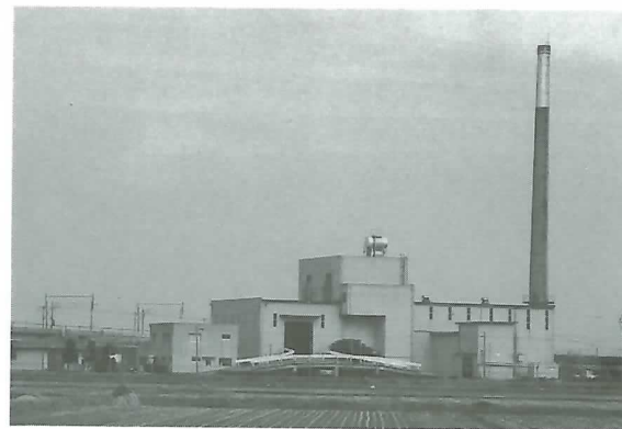
◀ 新築される清掃センター