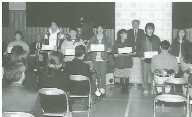
▶表彰を受けた子ども会の会長さん

今回表彰された子ども会は次のとおりで、各地区で美化活動や世代間交流事業など、工夫をこらした活動を積極的に進めています。