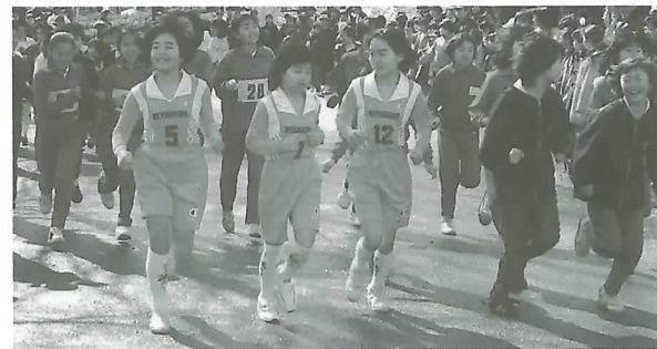
◀元よくスタートノ