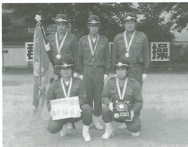
◀小型動力ポンプの部の優勝メンバー