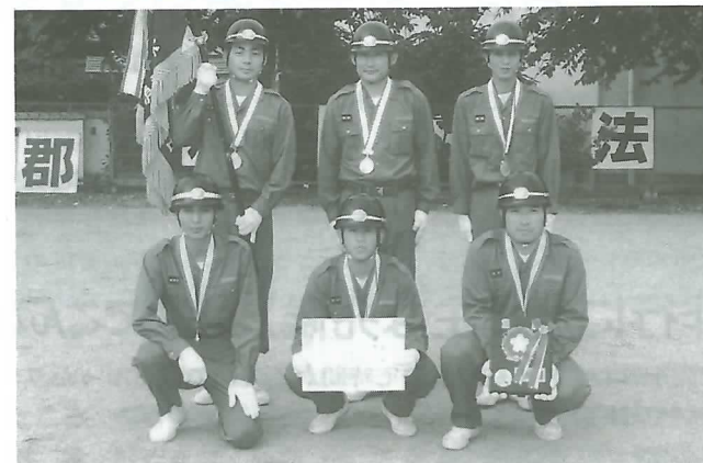
◀自動車ポンプの部の優勝メンバー