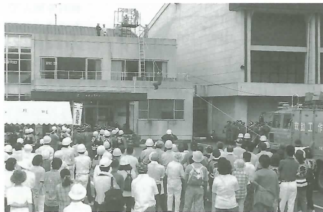
▲高所の逃げ遅れた者をロープで救助

参加者はそれらを見学したり、煙の体験コーナーや応急手当コーナーなどに参加したりと、万が一のときのために真剣に取り組んでいました。