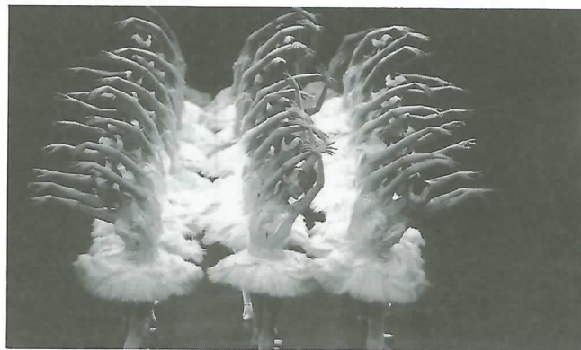
▲華麗な踊りと音楽で観衆を魅了