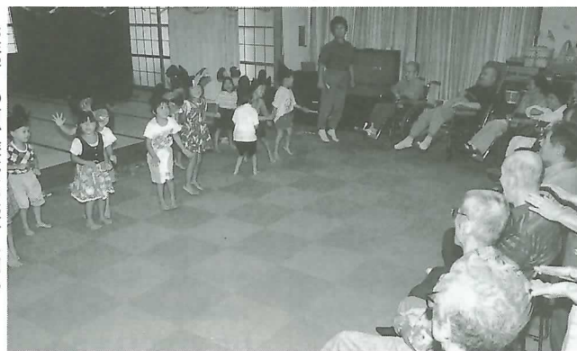
▶お年寄りの前で遊戯を披露する園児

初日は、12人の園児が訪問し、お年寄りが園児と一緒に楽しく遊戯などが行われ、お年寄りは楽しいひとときを過ごしました。