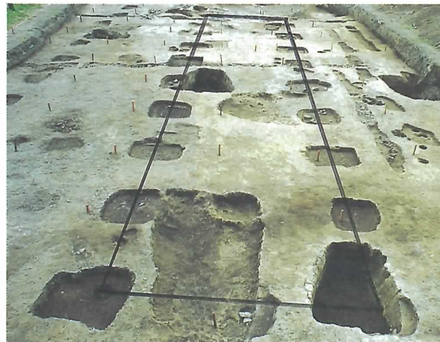
▶大型掘立柱建物跡

7月末から府中御旅神社南側で行われてきた美濃国府発掘調査で、大きな発見がありました。見つかったのは、大型の掘立柱建物一棟と柵の跡です。この建物は、国府の中心に当たる政庁の中の脇殿であることや、政庁を柵列が取り囲んでいたことがわかりました。また、以前御旅神社西側で見つかった建物が正殿であることや、政庁の正確な位置や規模も明らかになり、6度にわたる調査がようやく実を結びました。