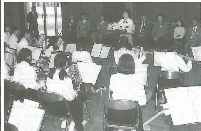
▲ブラスバンド部の演奏を聴く（北中学校）