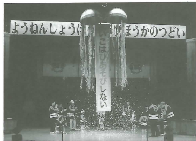
▲園児らによるくす玉割り

園児は館外に避難し、最後に「火遊びはしません」と全員で誓いの言葉を唱和しました。