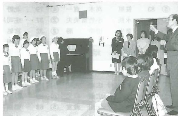
◀ 新入団員を前に「牧場の小牛」を合唱する在団生