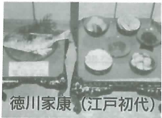
徳川家康 (江戸初代)

▲ ハマグリの塩蒸し、里芋とゴボウなどの煮物、タイの焼き物、カブのみそ汁、納豆、麦飯