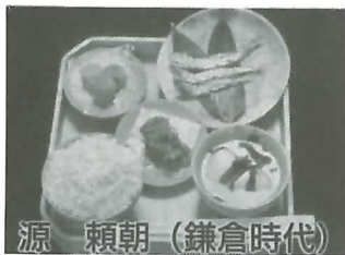
源 頼朝 (鎌倉時代)