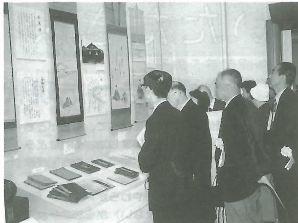
▶貴重な資料に見入る人たち